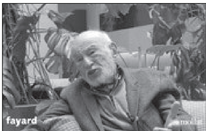
2020. Edgar Morin