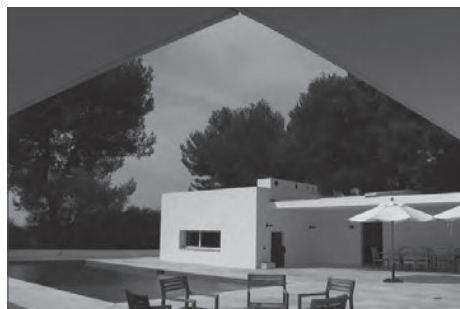
FONDATION HARTUNG BERGMAN

En 2021, le Museo Reina Sofia a consacré une exposition magistrale à l'œuvre d'Anna-Eva Bergman qui met en évidence l'importance de sa pratique pour l'histoire de l'abstraction de la seconde moitié du XXe siècle. Cette grande rétrospective sera présentée au Musée d'art moderne de la Ville de Paris en 2023 puis voyagera dans toute l'Europe et probablement aux États-Unis par la suite.