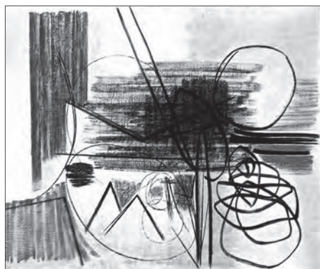
HANS HARTUNG T1946-17 (1946)