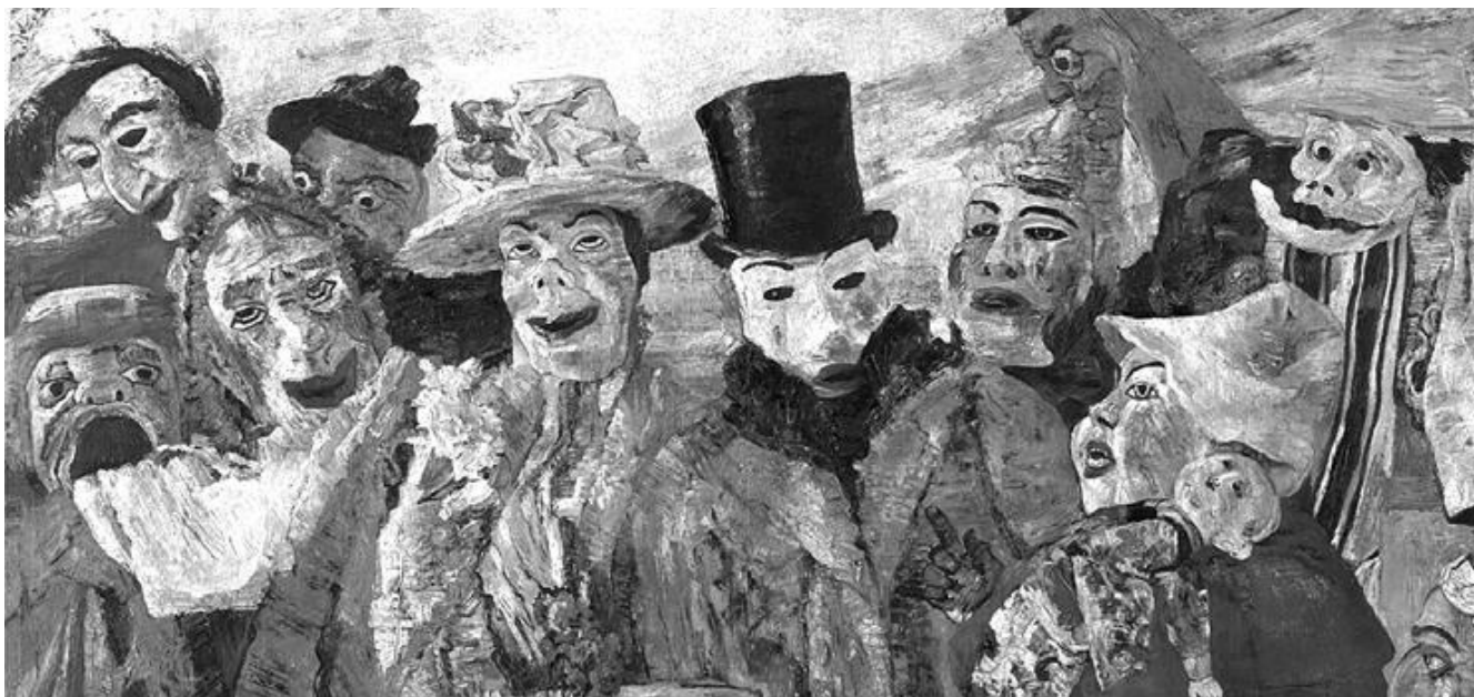
BRASIL tarsila do amaral O lago, 1928 - Hecilda e Sergio Fadel C Tarsila do Amaral

Le Musée royal des Beaux-arts d'Anvers (KMSKA) qui possède le plus de toiles de James Ensor au monde propose l'apothéose de cette année anniversaire entre Ostende, Bruxelles et Anvers. Mais l'angle choisi vise à proposer de nouvelles pistes autour de sa grande polyvalence, comme le souligne Herwig Todts, commissaire, dans l'indispensable catalogue, qui bien au-delà des masques, est tout à fait pertinent. Si Ensor regarde du côté des Impressionnistes par l'intermédiaire du groupe des XX : Monet, Manet, ou du réalisme de Courbet, il embrasse aussi les fulgurances d'Odilon Redon, de Félicien Rops, John Martin, Edvard Munch, Ernst Josephson,