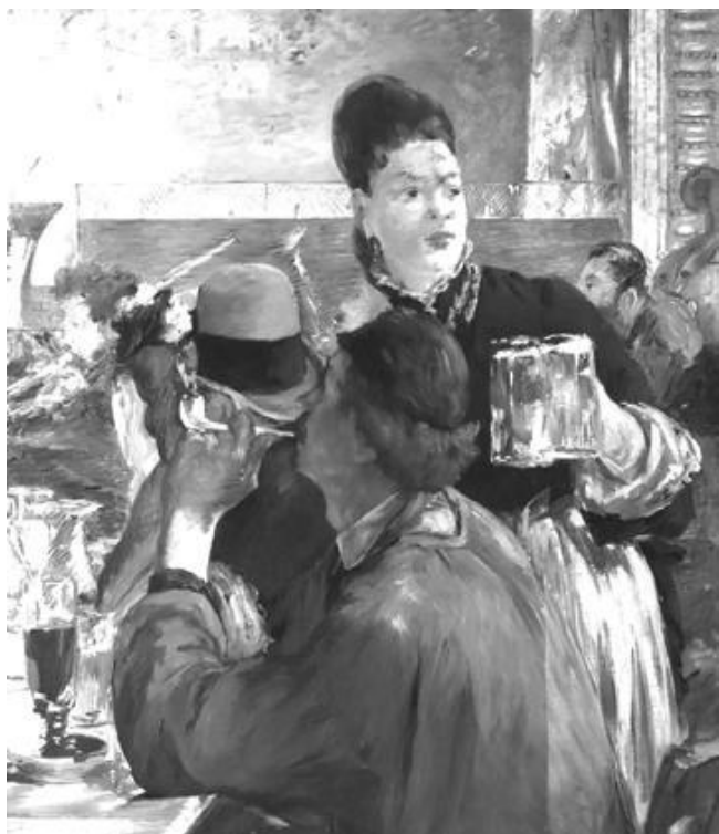
Edouard Manet | Corner of a Café-Concert

ethnographique de Berlin et toujours issus de pays non européens, contrairement à son confrère belge. Le parcours se termine sur une composition abstraite d'Ensor, à rebours des motifs précédents d'une grande modernité et une œuvre de l'artiste contemporaine Marlène Dumas intitulée Ensor, Andy Warhol meets His Maker ,